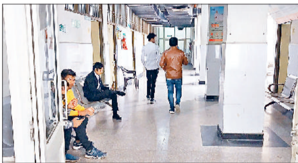
रेवाड़ी। हड़ताल के दौरान खाली पड़ा अस्पताल।

अपनी मांगों को लेकर जिले के सरकारी अस्पतालों के डॉक्टर पहले भी दो घंटे के लिए ओपीडी बंद कर चुके हैं। इसके अलावा काले बिल्ले लगाकर रोष प्रदर्शन भी कर चुके हैं। मांगों को लेकर एसोसिएशन की ओर से सिविल सर्जन, उपायुक्त व स्वास्थ्य महानिदेशक के साथ जनप्रतिनिधियों को ज्ञान सौंपकर पहले ही चेताया जा चुका है। 21 दिसंबर को डॉक्टरों ने उपायुक्त को ज्ञान सौंपा था। इससे पहले 9 दिसंबर को दो घंटे तक ओपीडी सेवाएं बाधित कर अपना रोष प्रकट