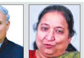
राव इंद्रजीत सिंह।