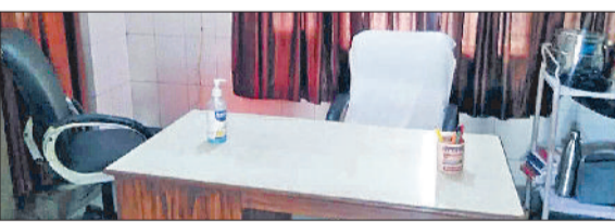
महेंद्रगढ़। नागरिक अस्पताल में खाली पड़ी चिकित्सक की कुर्सी।