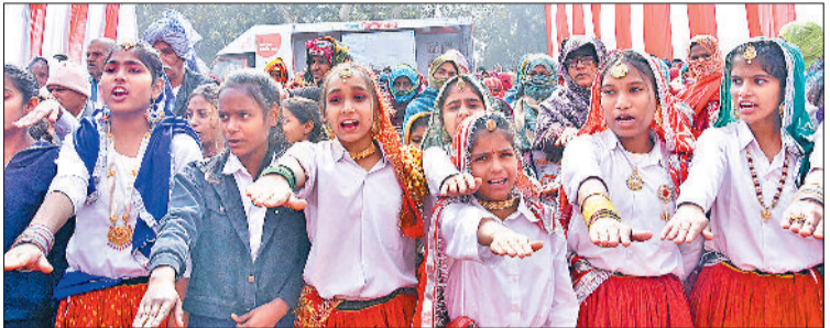
रेवाड़ी। कार्यक्रम में शाय लेते हुए छात्राएं व ग्रामीण।