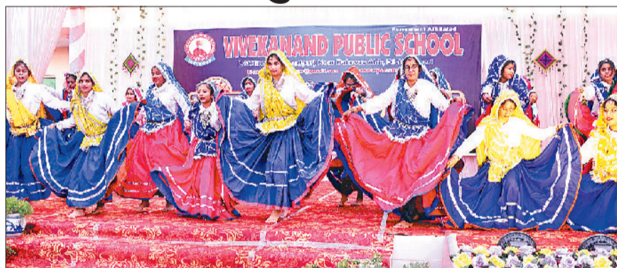
रेवाड़ी। हरियाणवी डांस की प्रस्तुति देते हुए छात्राएं।