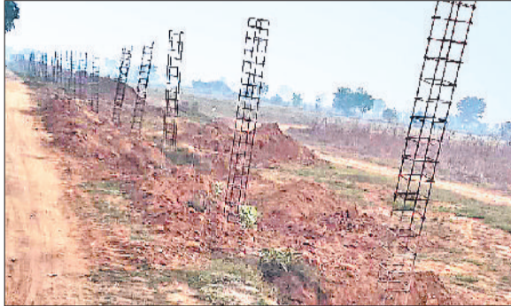
रेवाड़ी। माजरा एम्स की जमीन पर बन रही चारदीवारी, शिलान्यास की मांग को लेकर घरने पर बटे ग्रामीण।

सीएम की वर्ष 2015 में मनेठी में एम्स खोलने की घोषणा के बाद केंद्र सरकार की इस परियोजना को अमलीजामा पहनाए जाने की राह आसान नहीं है। सीएम की घोषणा के बाद एम्स को लेकर क्षेत्र के लोगों ने बड़े-उत्तार चढ़ाव देखे हैं। जब मनेठी एम्स की संभावनाओं पर पानी फिरता नजर आया तो एम्स संघर्ष समिति का उदय हुआ। इस समिति के 127 दिन के आंदोलन के बाद एम्स खोलने की योजना