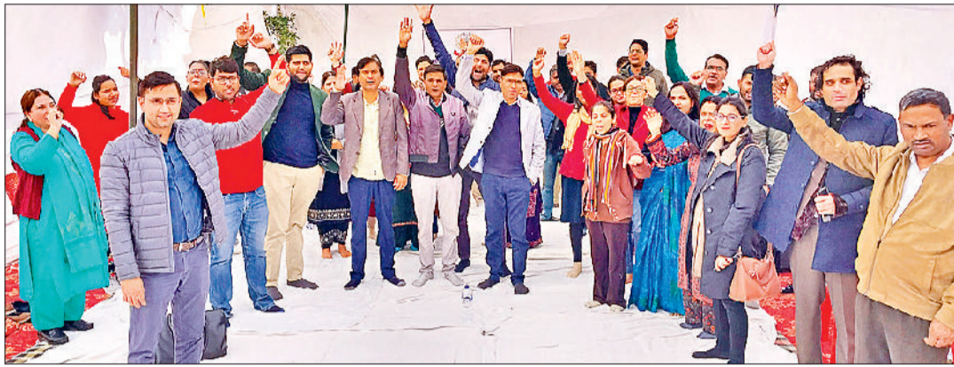
रेवाड़ी। हड़ताल पर प्रदर्शन करते डॉक्टरों, जानकारी देते हुए एसोसिएशन के पदाधिकारी।

हरियाणा सिविल मेडिकल सर्विसेज (एचसीएमएस) एसोसिएशन की ओर से बुधवार को मांगों को लेकर की गई हड़ताल के कारण जिले के नागरिक अस्पताल व सरकारी स्वास्थ्य केंद्रों में ओपीडी पूर्णतया: बंद रही। हड़ताल के दौरान सभी सरकारी चिकित्सकों ने नागरिक अस्पताल में धरना-प्रदर्शन किया। हालांकि हड़ताल के दौरान अस्पताल व स्वास्थ्य केंद्रों में इमरजेंसी और पोस्टमार्टम सुविधाएं सुचारू थीं, लेकिन रोजाना की ओपीडी पर असर पड़ा। नागरिक अस्पताल में काफी लोग डॉक्टरों को दिखाने के लिए परेशान नजर आए। एचसीएमएस एसोसिएशन की ओर से सरकार को एक दिन का अल्टीमेटम दिया गया है। अगर सरकार की ओर से डॉक्टरों की प्रमुख मांगों पर सजान नहीं लिया गया तो 29 दिसंबर से एसोसिएशन की शटडाउन हड़ताल शुरू होगी, जिसमें सरकारी अस्पतालों की ओपीडी सहित इमरजेंसी, पोस्टमार्टम व लैबर रूम की सुविधा