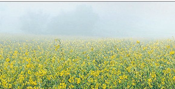
रेवाड़ी। एक खेत में कोहरे की चादर में ढकी सरसों की फसल।

बना रह सकता है। गत वर्ष दिसंबर माह का दूसरा पखवाड़ा शुरू होते ही कड़ाके की ठंड ने कंपकंपाना शुरू कर दिया था। इस बार कड़ाके की ठंड देरी से शुरू हो रही है। बुधवार को पहली बार अधिकतम तापमान 4.2 डिग्री सेल्सियस गिरकर 20 डिग्री सेल्सियस पर आ गया। न्यूनतम तापमान 1.5 डिग्री सेल्सियस बढ़कर 7 डिग्री पर पहुंच गया। गत वर्ष 27 दिसंबर को अधिकतम तापमान 19 और न्यूनतम 5 डिग्री सेल्सियस दर्ज किया गया था। पहली बार दिन का तापमान गिरने से दोपहर के समय भी लोगों को कड़ाके की ठंड का अहसास होने लगा। दिन में तेज धूप खिलने के बाद लोग पार्कों में