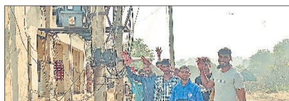
रेवाड़ी। ट्रांसफार्मर दिखाते हुए युवक।