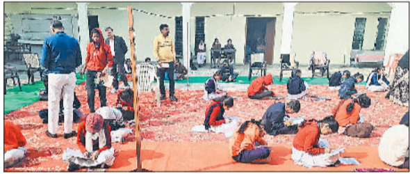
रेवाड़ी। प्रतियोगिता में भाग लेते बच्चे।