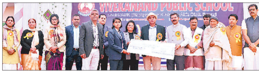
रेवाड़ी। विद्यार्थियों को छात्रवृत्ति प्रदान करते हुए अतिथि व निदेशक।